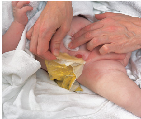
Drücken Sie dabei vorsichtig eine Komresse gegen die Haut, während Sie die Versorgung in die Gegenrichtung abziehen.