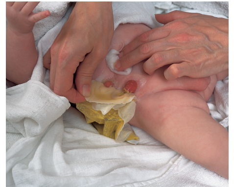
Warmes Badewasser erleichtert die Entfernung der Versorgung.