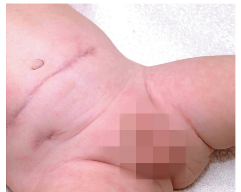
Vier Monate nach seiner ersten Operation konnte Emils Stoma zurückverlegt werden. Die Verdauung nimmt ihren üblichen Weg ohne Probleme. Die einzige Erinnerung an das Stoma ist die Narbe auf dem Bäuchlein.

Rückverlegung des Stomas In den meisten Fällen kann ein Stoma in den üblichen Darmverlauf zurückverlegt werden; manchmal schon nach 2-6 Monaten.