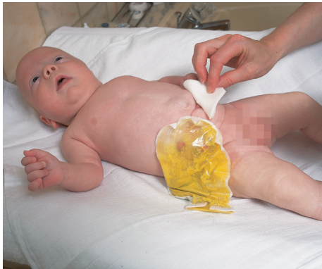
Nach dem Trocknen beginnen Sie mit dem Ablösen der alten Versorgung.

Die Passage des Stuhlgangs ist unterbrochen durch einen Darmteil, der noch nicht ausgereift ist.