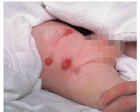
Wenn Sie sicher sind, dass die Haut absolut trocken ist, kann die neue Versorgung angebracht werden.