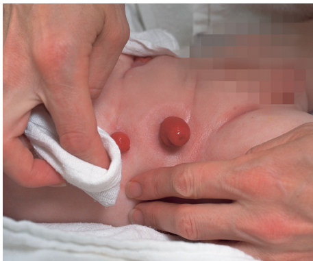
Trocknen Sie die Hautumgebung des Stomas sorgfältig.