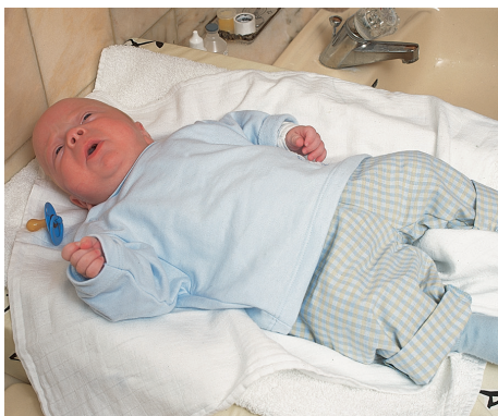
Die Stomaversorgung und -pflege sind normalerweise keine unangenehmen Erlebnisse für das Kind. Es wird direkt nach dem Versorgungswechsel wieder anfangen, ungehindert die Welt für sich zu entdecken.

Rückverlegung des Stomas In den meisten Fällen kann ein Stoma in den üblichen Darmverlauf zurückverlegt werden; manchmal schon nach 2-6 Monaten.